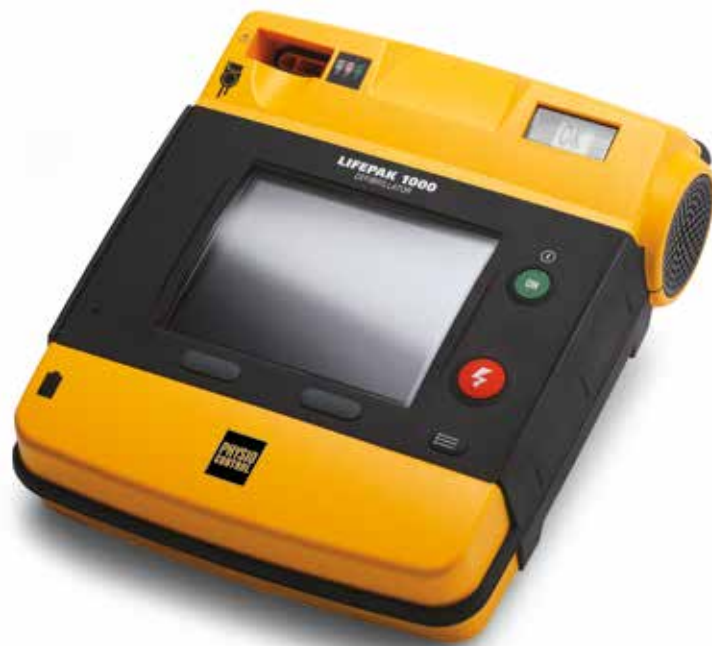
DÉFIBRILLATEUR LIFEPAK® 1000